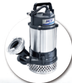
All 0.5HP PCD 84mm