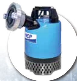
GD 0.5~1HP PCD 74mm