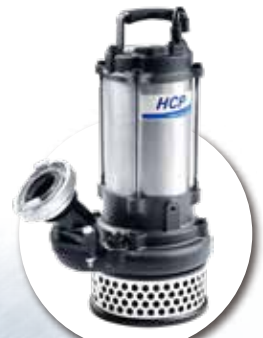
All 0.5~3HP PCD 96mm