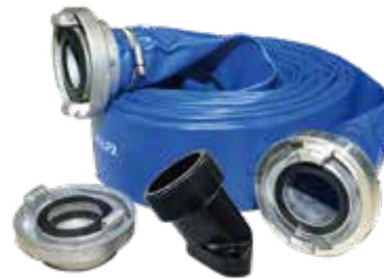
SH2A/B/C-10S PRO PF